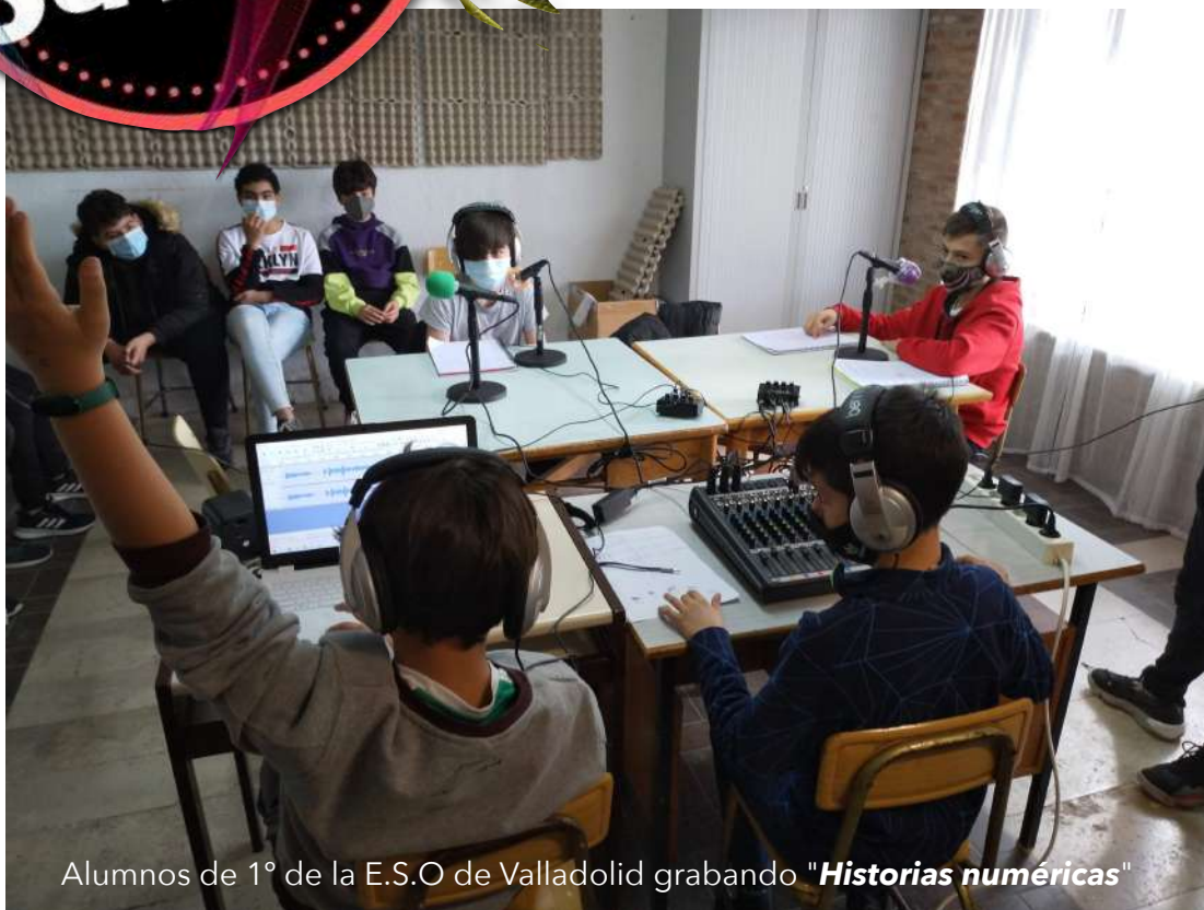
Alumnos de 1º de la E.S.O de Valladolid grabando " Historias numéricas "